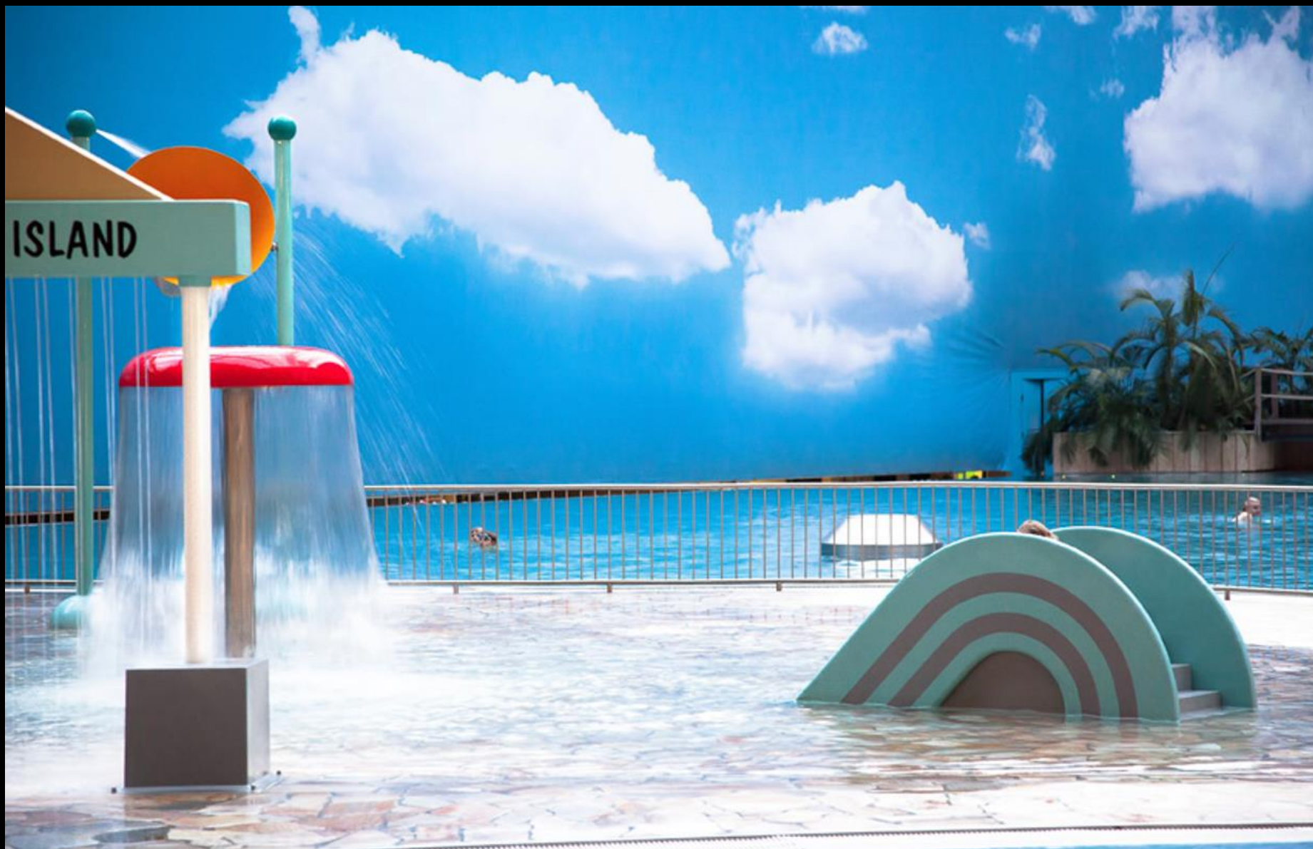
Romy Pocht, Sem título , 2010 Fotografia, Série Tropical, 60 x 90 cm