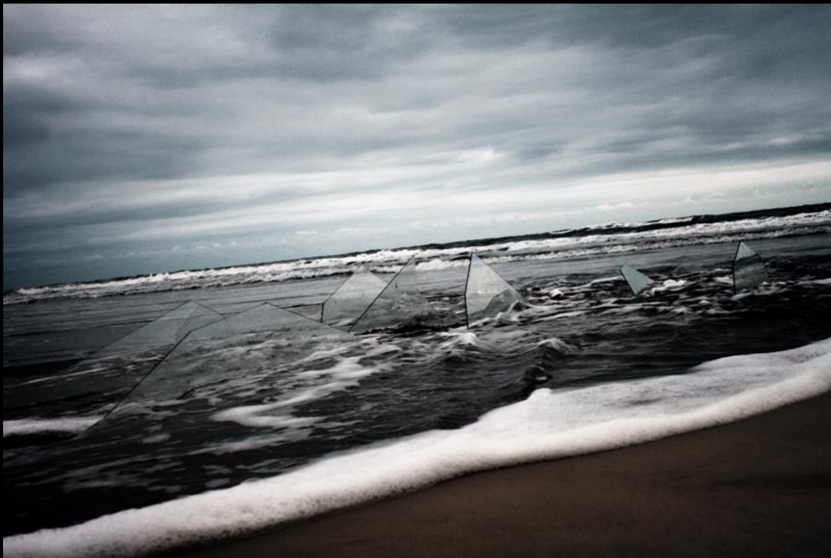
Ío (Laura Cattani e Munir Klamt), Halo XII , 2013 Fotografia , 54.5 x 83.5 cm