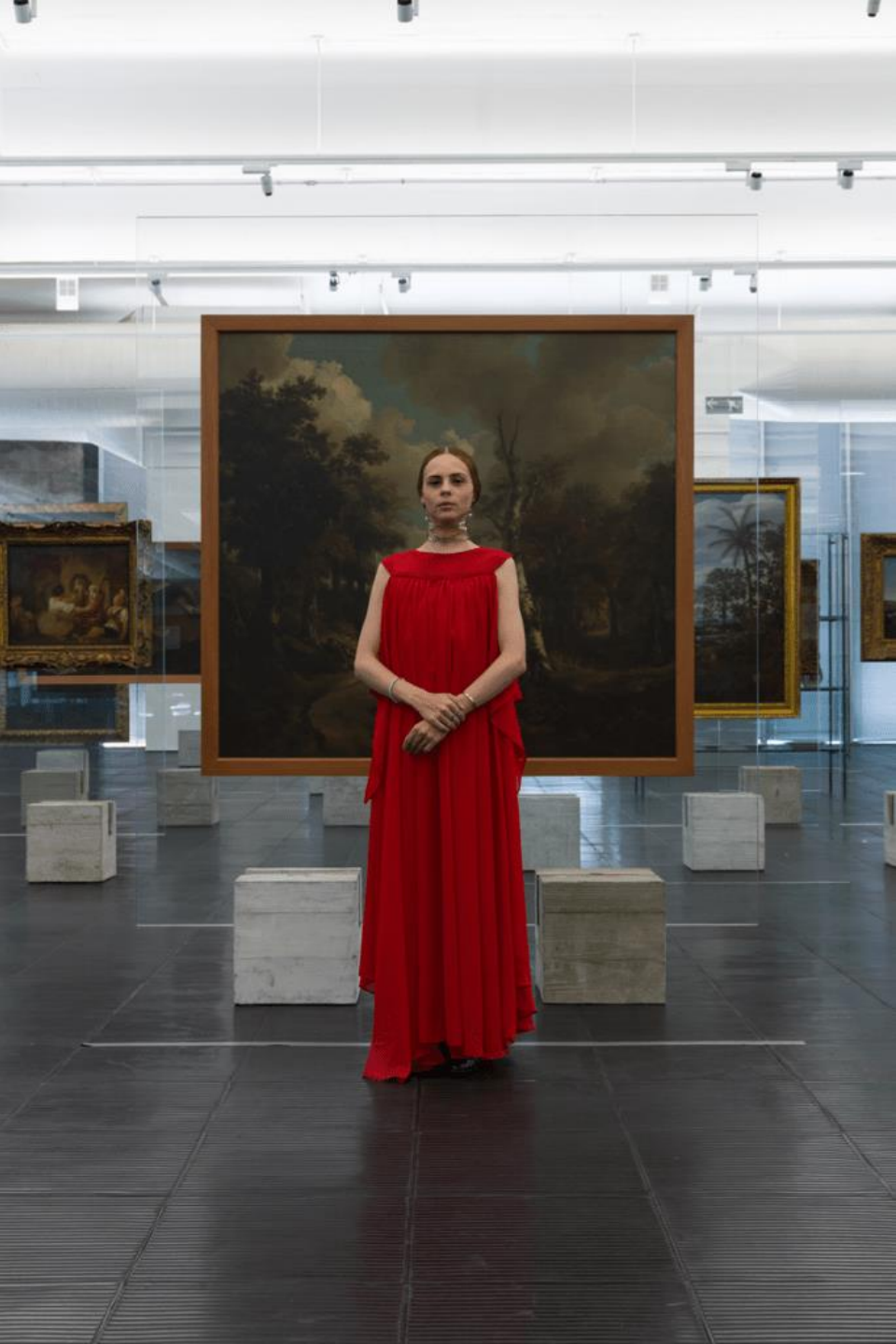
Élle Bernardini A imperatriz na paisagem , 2019 Fotoperformance 120 x 80 cm