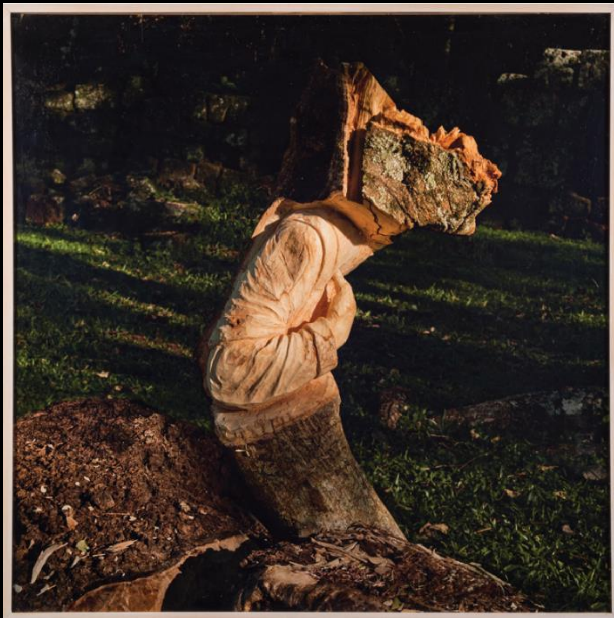
Maria Elvira Escalón San Isidro , 2011 Fotografía sobre papel, 100x100 cm