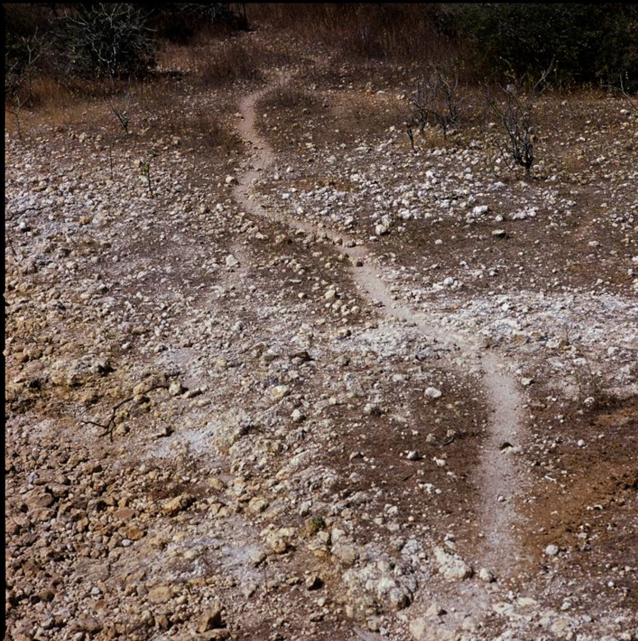
Pedro David, Trilha , 2009 Série Homem de Pedra 101 x 101 cm