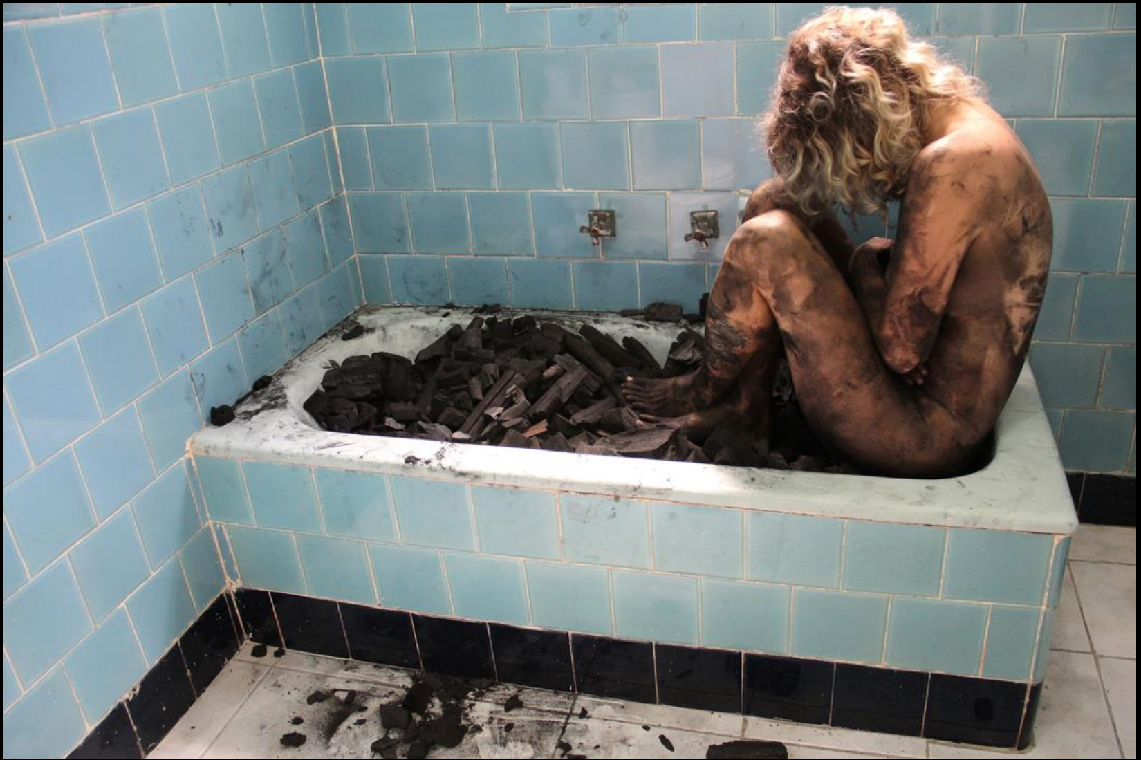
Carla Borba, Salle de bains III , 2012 Fotografia sobre papel 100 x 150 cm