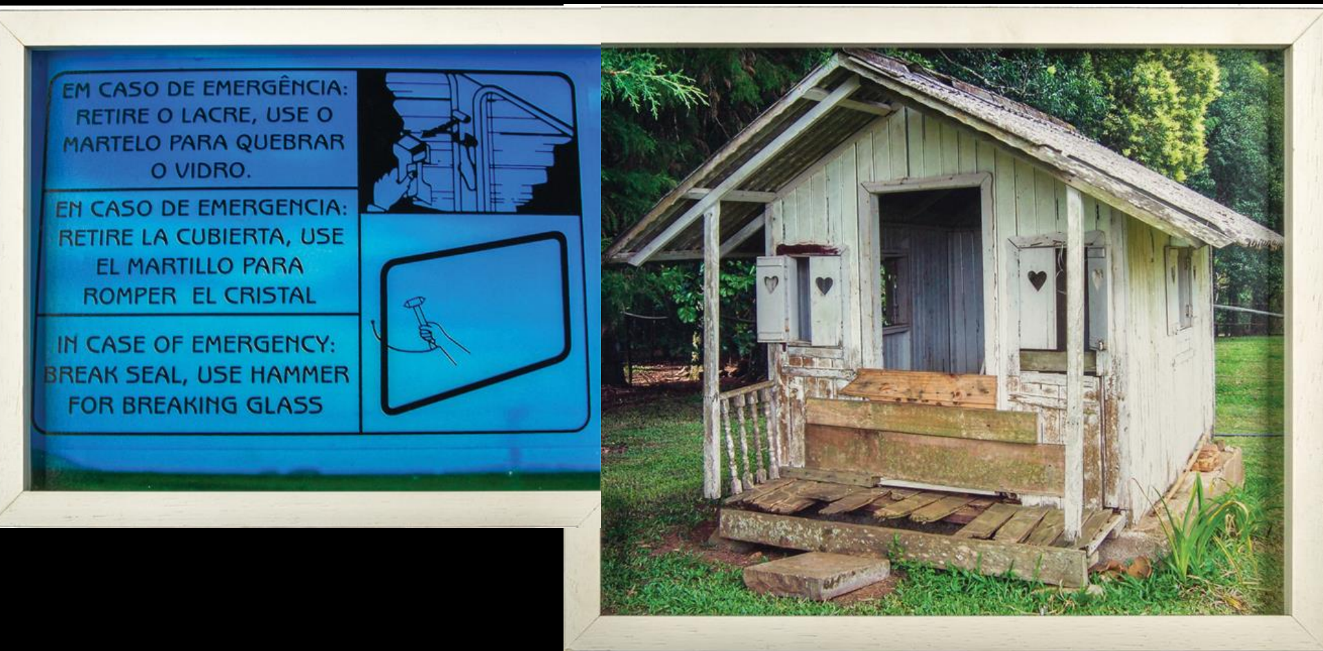
Hélio Fervenza, Traveling – de uma casa a outra , 2007