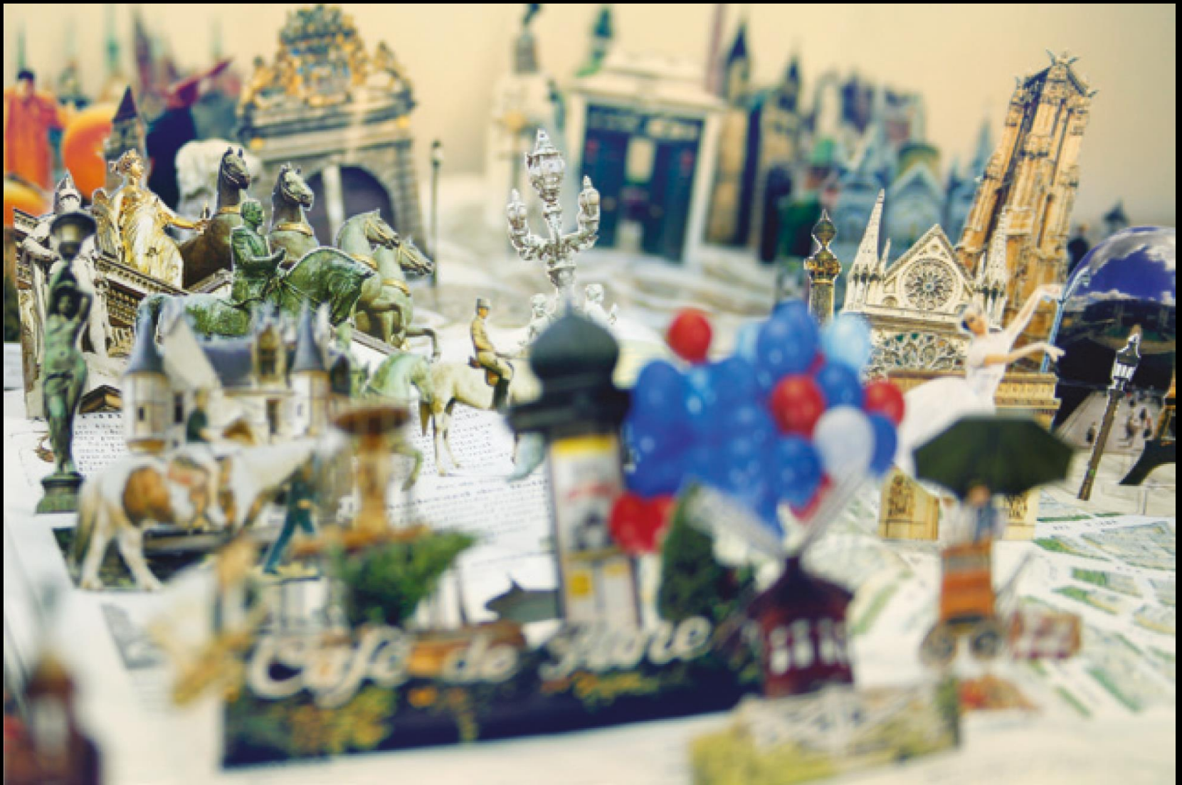
Daniel Escobar, The World #03 , 2012 Fotografia em backlight , 57,7 x 87 cm