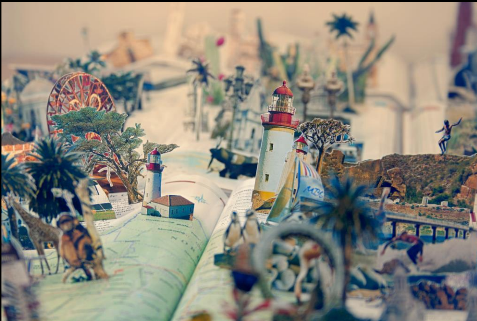
Daniel Escobar, The World #02 , 2012 Fotografia em backlight , 57,7 x 87 cm