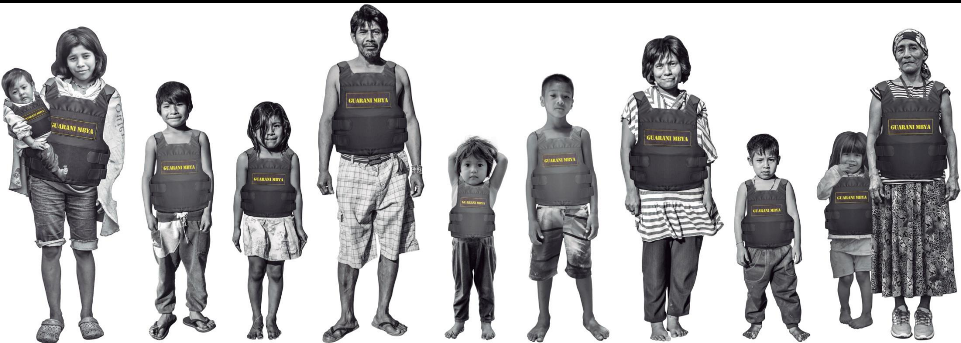
Xadalú Tupã Jekupé Invasão colonial meu corpo nosso território , 2019 Fotomontagem sobre papel, 35,5 x 110 cm