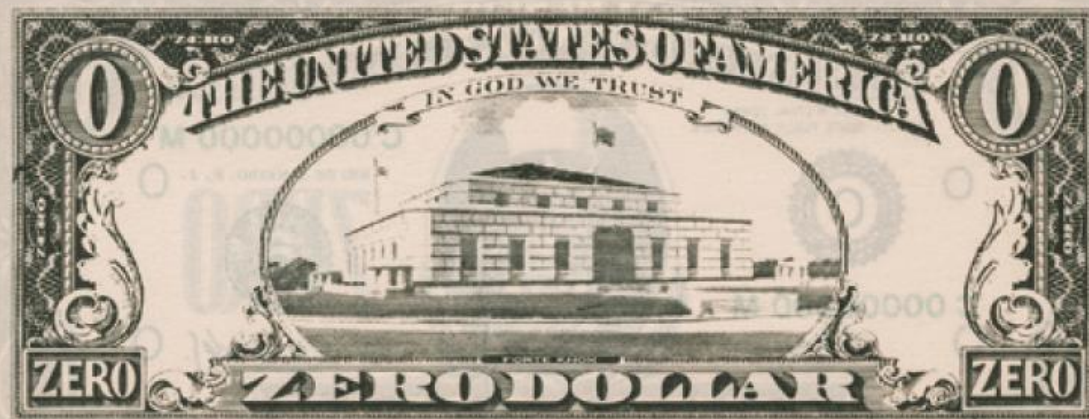
Cildo Meirelles Zero dólar, 1974 Litografia sobre offset, 6,1 x 15 cm