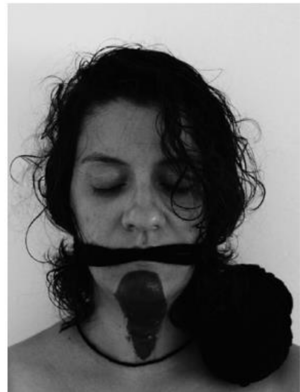
Camila Moreira, Le trois singes , 2019 Fotografia sobre papel, 70 x 50, 100 x 80, 70 x 50 cm