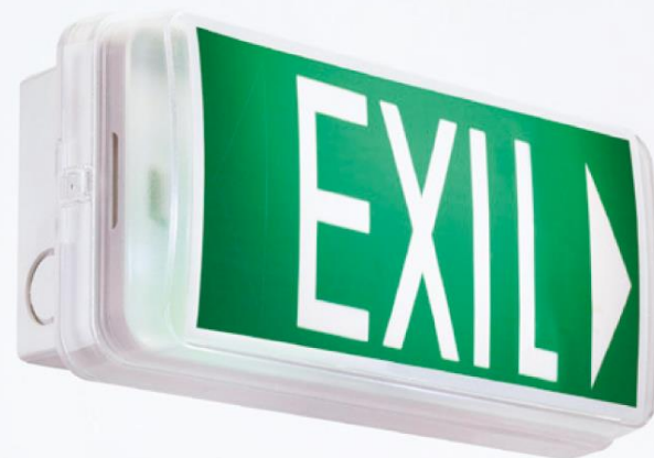
Lina el-herfi, ExiL où exit? , 2019 Foto, 46 x 46 cm cada