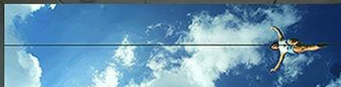
Helena Martins-Costa, Por um fio , 2012 Videoinstalação, 900 x 80 cm (Dimensões variáveis)