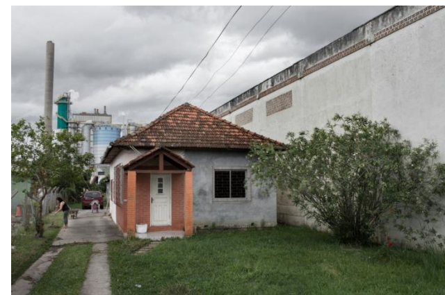
Thiago Coelho, Balneário Alegria , 2015 83 x 63 cm e 55 x 38 cm