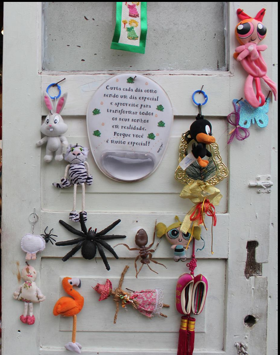
Elaine Tedesco, Guarita – Interna 6 , 2012 Fotografia, 80 x 120