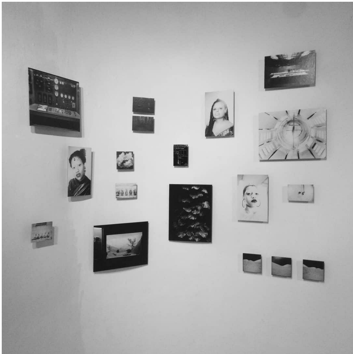
Vitória Macedo Todas as mulheres do mundo, 2019 Fotografias entre 12 x 12 cm e 30 x 40 cm cada