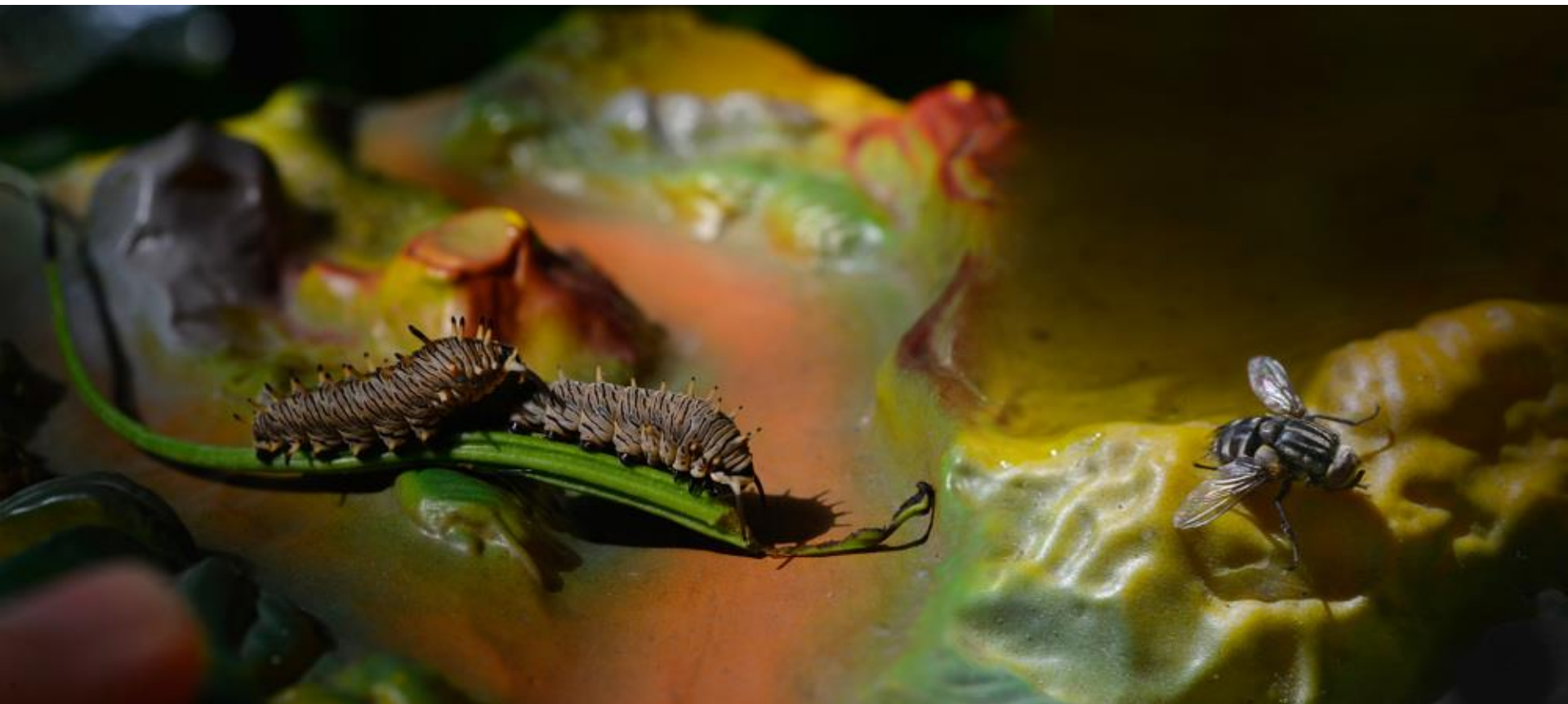
Rochele Costi, Paisagem Séria Casa & Jardim, Fotografia, 45 x 100 cm