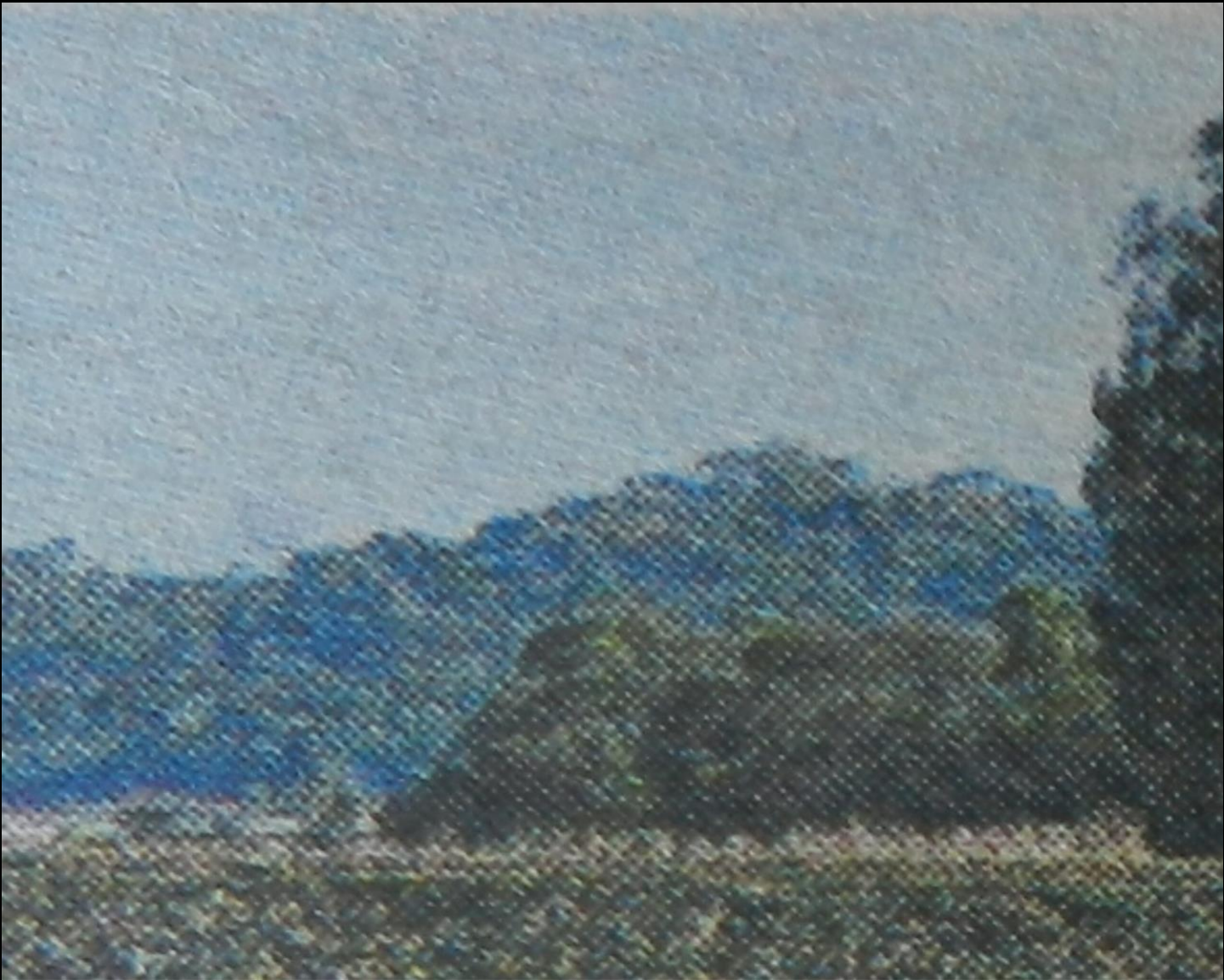
Dirnei Prates, Polícia inspecionará poços em busca de jovem sumida , 2013 Série Verdes Complementares Fotografia digital