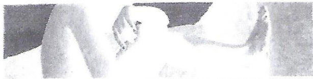
QUASE RETRATO R3, IMPRESSÃO DIGITAL E GRAFITE, 24 cm X 100 cm, 2004

Wischral faz isso quando digitaliza a imagem. Ele transforma a sua imobilidade para depois devolver-lhe, através do desenho, todas as características retiradas; cria texturas com o grafite, acentua ou desvanece luz e sombra, modifica seu ambiente, descontextualiza o fundo tornando-o abstrato, usa toda a capacidade de criação e invenção que o desenho lhe permite.