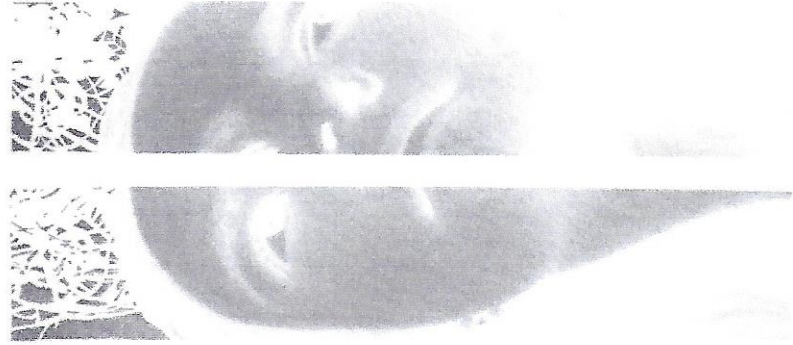
GÊMEOS F1, IMP. DIGITALE GRAFITE, 100 cm X 24 cm, 2006 GÊMEOS F2, IMP. DIGITALE GRAFITE, 100 cm X 24 cm, 2006